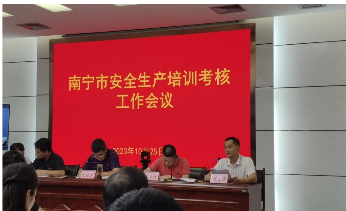
学校代表做先进经验交流发言

2023年10月25日，在南宁市应急管理局召开的全市安全生产培训考核工作会议中，学校代表做先进经验交流发言，得到了应急管理主管部门的高度认可。